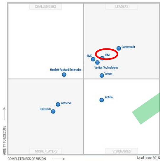
Figure 1. Magic Quadrant for Data Center Backup and Recovery Software