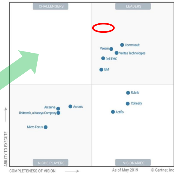
Figure 1. Magic Quadrant for Data Center Backup and Recovery Solutions