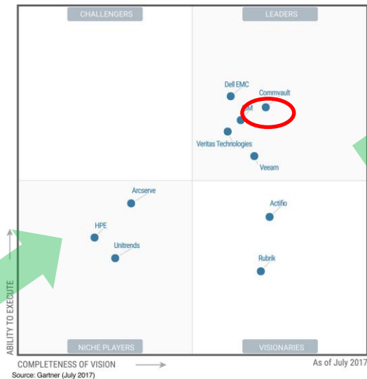
Figure 1. Magic Quadrant for Data Center Backup and Recovery Solutions